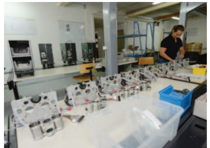
Compliqué de tirer le meilleur du grain torréfié. MAMIN

La 28 e édition du Prix Sommet s'est fixé pour but de mettre en évidence des entreprises valaisannes exportatrices. Eversys entre parfaitement dans cette catégorie, elle qui exporte 90% de ses produits dans toute l'Europe, au Moyen-Orient, en Amérique du Nord, en Asie, en Australie et Nouvelle-Zélande et qui vise de nouveaux marchés étrangers pour l'année prochaine, dont les géants que sont la Chine, l'Inde et la Russie. o