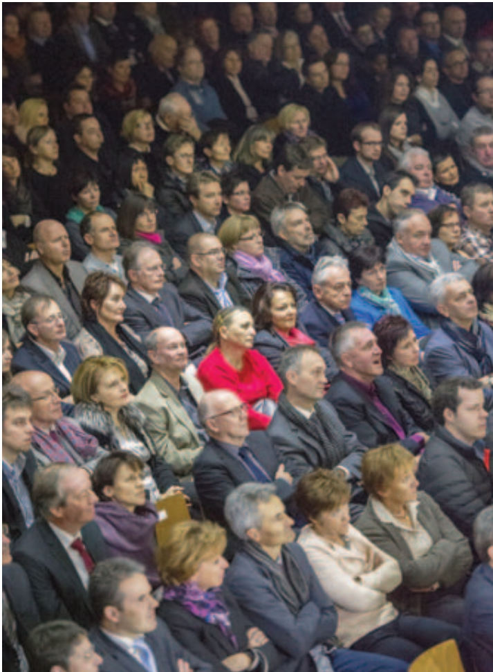
Salle comble hier soir à Châteauneuf pour la remise du Prix Sommet 2013. BITTEL